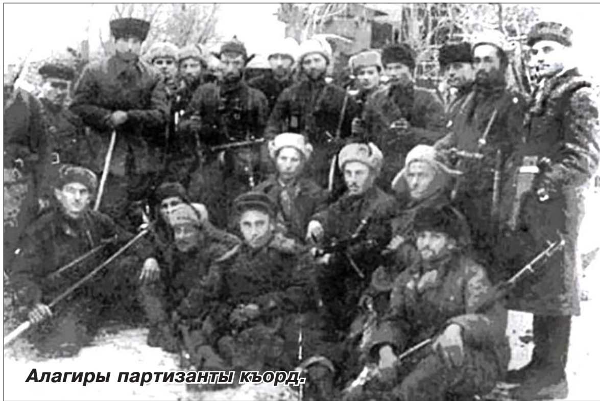
Алагирь партизаны кьорд.

той ацы зиантыл, фæлæ сæ бон цы уыд æндæр. Мæхæдæг нæ хъуыды кæнын, фæлæ, хъæуы цæрджытæ фæстæдæр куыд дзырдтой, афтæмæй тугуарæн бонты ирон лæг немыцаг булкьоны уæладарæсы зылд хъæуы хæдзæрттыл, æмæ, дам, ирон адæм, кæрæдзийы ма нымдзут, фæлæ йæм ничи байхъуыста, æмæ уый тыххæй фæстæдæр зæгъдыстæм.